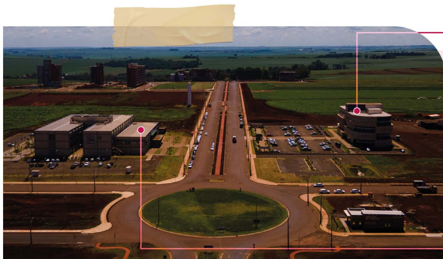
Edifício Charlles Darwin

Com localização privilegiada, integrada no Ecosistema do Parque Tecnológico , a Faculdade Biopark conta com 117 mil metros quadrados e muitas empresas residentes neste espaço, oferecendo estrutura completa e a melhor experiência de aprendizado.