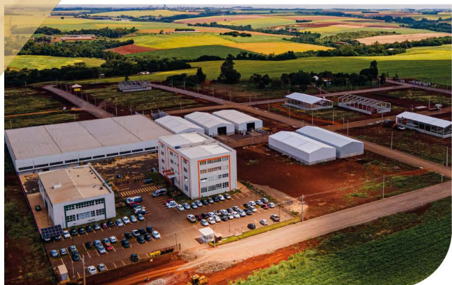
Queijaria Flor da Terra