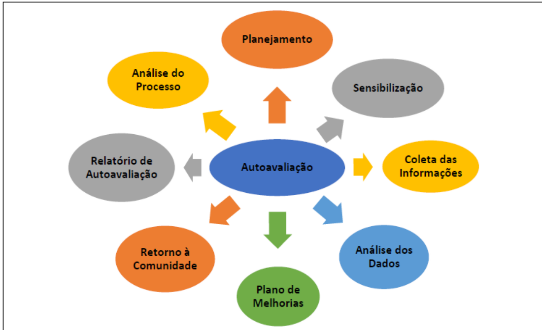
Figura 2: Ações desenvolvidas pela CPA.

A CPA em sua atuação desenvolve um conjunto de ações, de modo integrado, que envolve o planejamento, a sensibilização, a coleta das informações, a análise dos dados, plano de melhorias, o retorno à comunidade, a elaboração do relatório de autoavaliação e análise do processo, representado pela Figura 2.